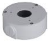
PFA134 Junction box