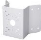
PFA151 Corner mount