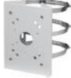
PFA150 Pole mount