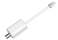
LR1002 Convertisseur ePoE sur coaxial