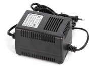
AC24V / 3A Power Adapter