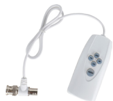
PFM820 Contrôleur UTC