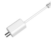
LR1002 Convertisseur ePoE sur câble coaxial