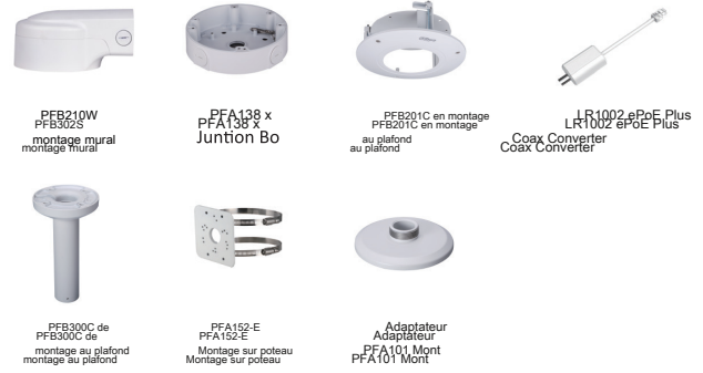
PFB302S Support mural